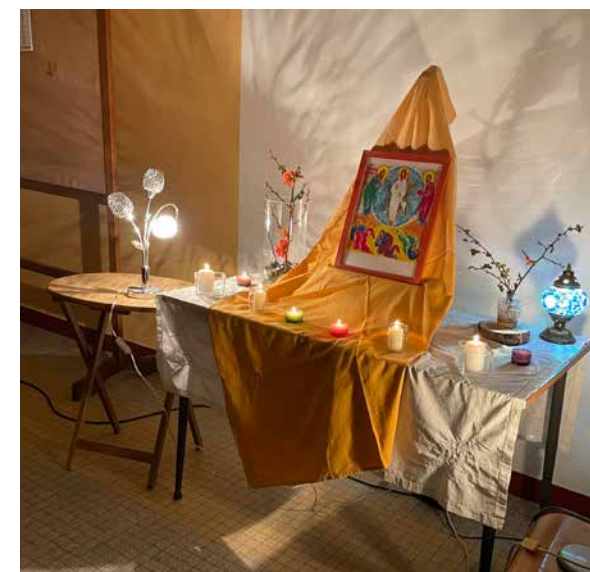
En ce début de carême, l'équipe CVX (Communauté de Vie Chrétienne) invitait à méditer l'Évangile de la Transfiguration et à prier à l'Espace Notre-Dame-de-Nantilly.