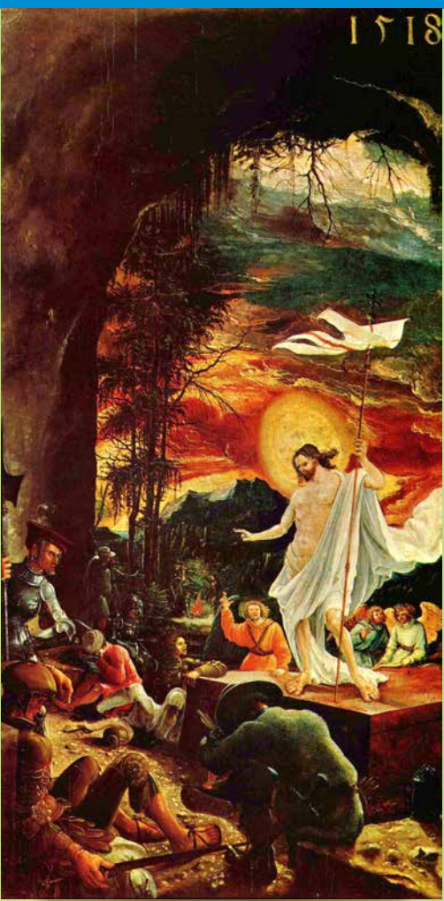
Résurrection de Jésus-Christ 1518 - Albrecht Altdorfer.