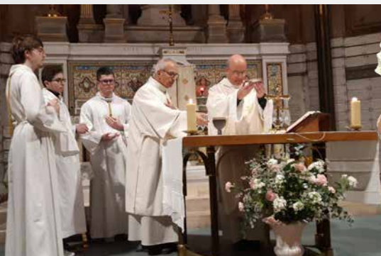
Église St-Augustin à Paris, office célébré dans la chapelle Notre-Dame où Charles de Foucauld s'est converti.