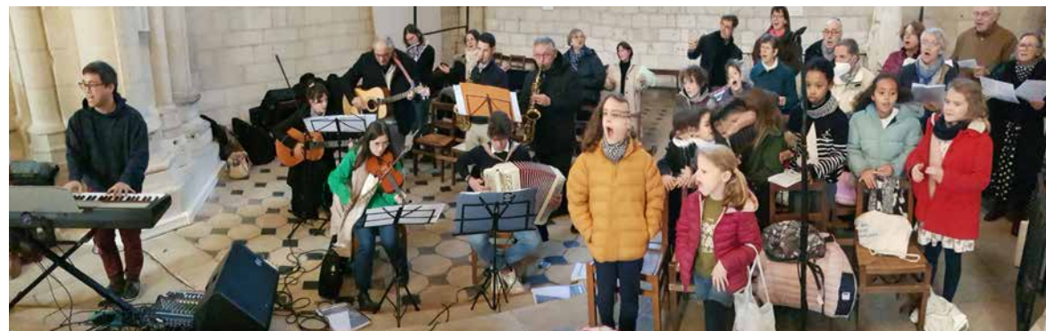
Participation musicale toutes générations lors du "Dimanche pour tous" à Notre-Dame-de-Nantilly.