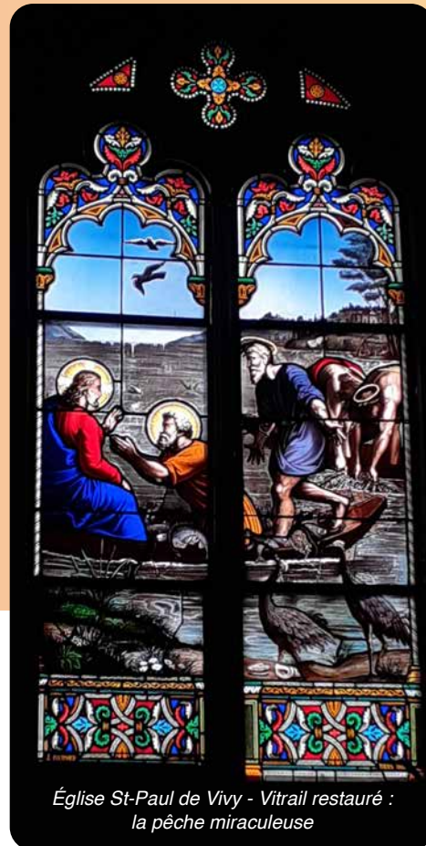
Église St-Paul de Vivy - Vitrail restauré : la pêche miraculeuse

Seigneur, c'est aujourd'hui le jour de votre Nom, J'ai tu dans un vieux livre la geste de votre Passion (...).