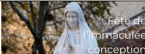
Fête de l'Immaculée conception

Lundi 9 décembre , Communauté des Sœurs, fête de l'Immaculée Conception, messe à 11h.