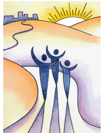
Charles de CERTAINES