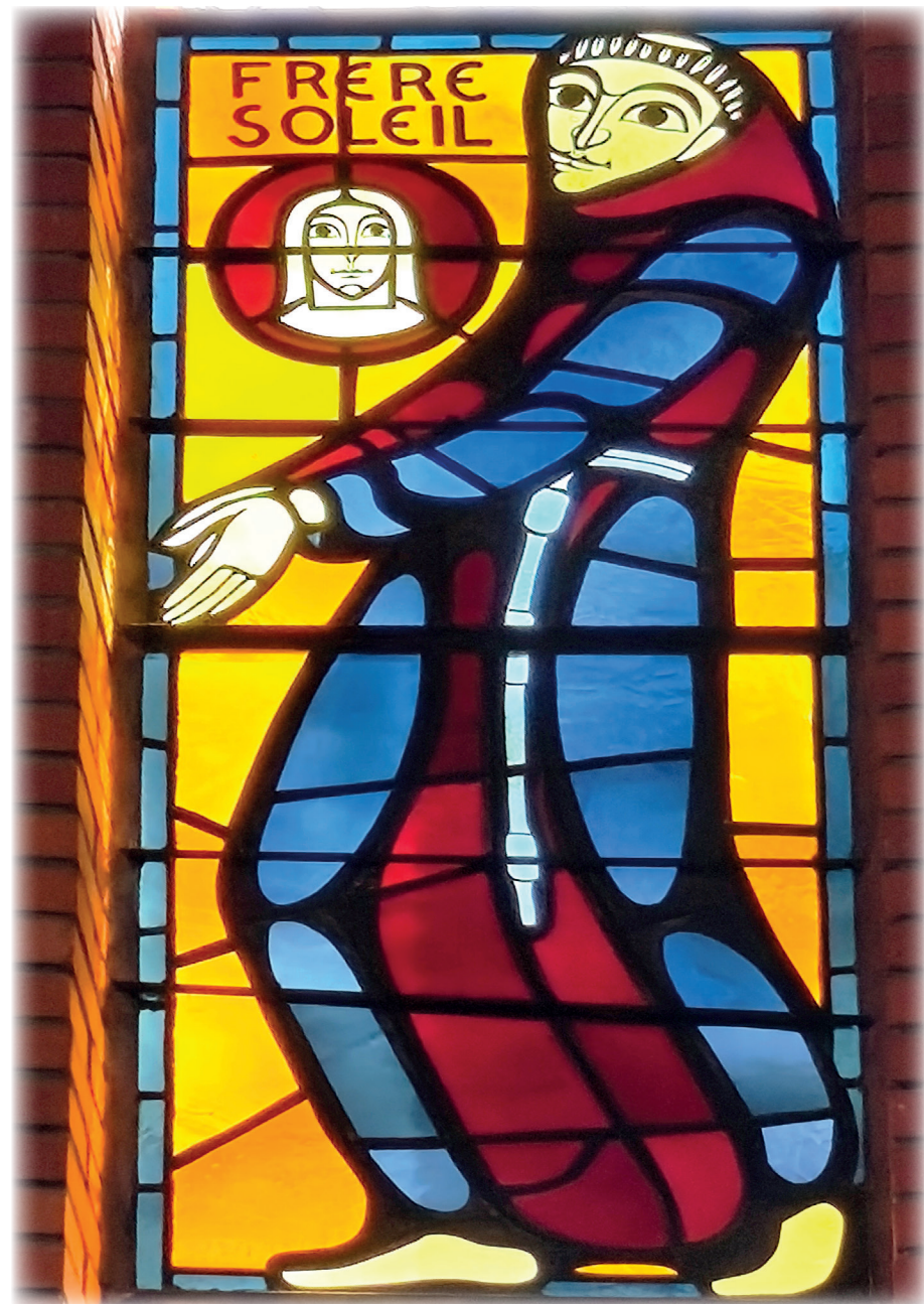
Chapelle Saint-François, Paris XIV*